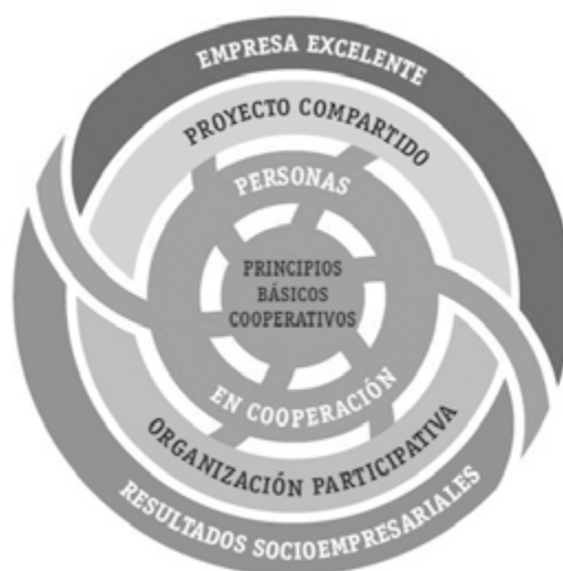
MODELO GESTIÓN CORPORATIVO MONDRAGON

Copreci es una Sociedad Cooperativa perteneciente al Grupo Mondragon , grupo de empresas cooperativas que declara unos valores de los que se derivan una serie de compromisos con sus trabajadores, socios, clientes y sociedad , basándose para ello en los principios básicos cooperativos y en su modelo de gestión .