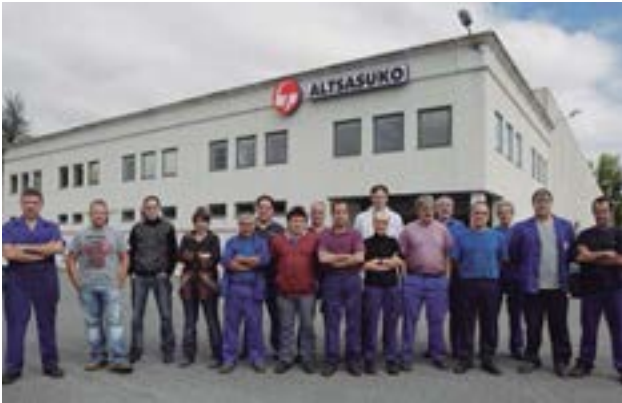
En la actualidad, la plantilla de Copreci Altsasuko está formada por unas 45 personas, que trabajan en su planta de Alsasua (Navarra).