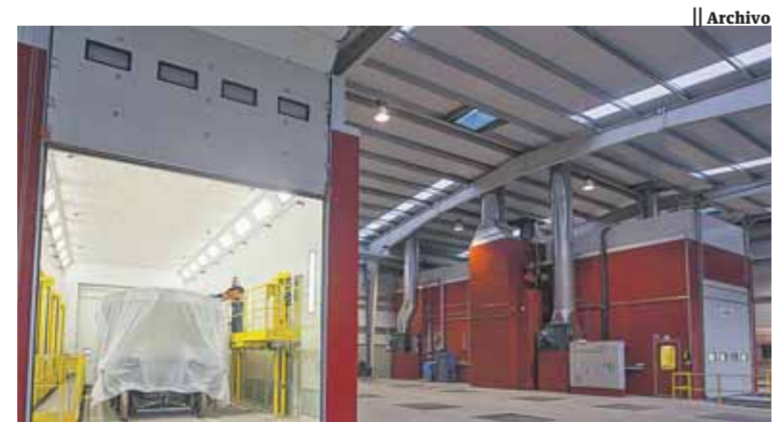
Geinsa desarrolla avances constantes en sus líneas de pintura.

Sus líneas de pintura están en numerosos sectores del mercado