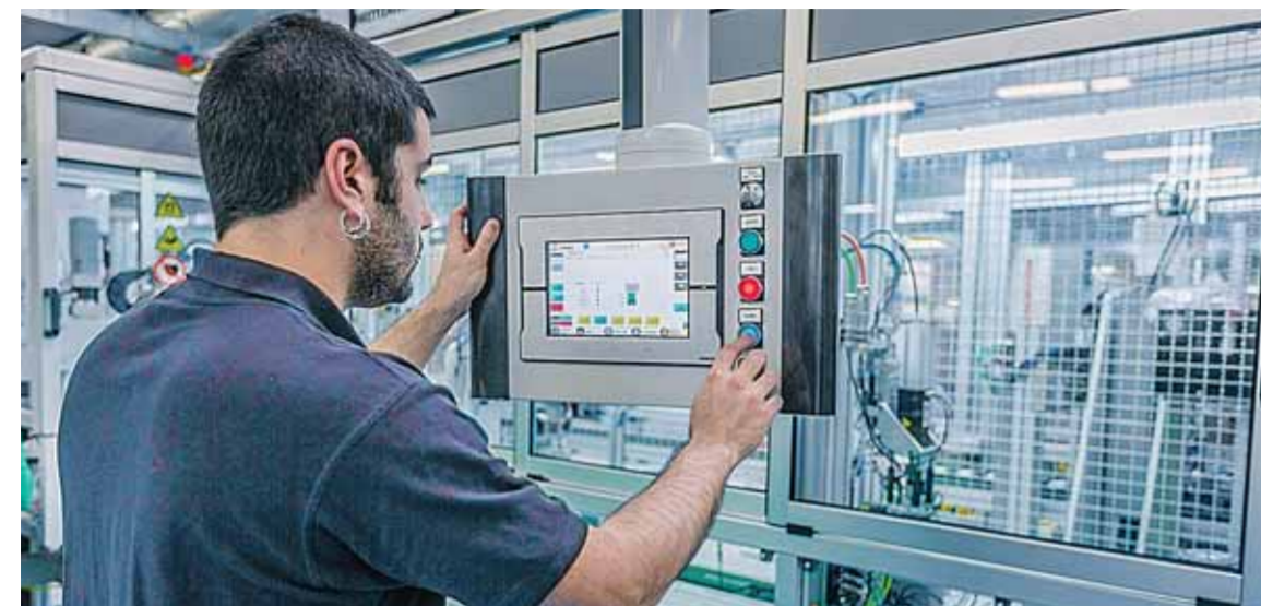
Copreci es hoy uno de los principales fabricantes mundiales de componentes para electrodomésticos, contando entre sus clientes con las grandes marcas del sector.